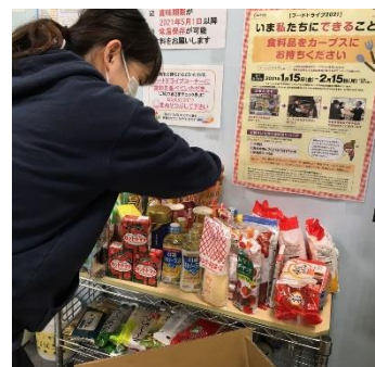
<第14回 フードドライブ実施風景>

“いいごはんの日”（1 月 15 日）を「フードドライブの日」と制定し、1 月 15 日からの 1 か月間を募集期間としました。既に、今期の活動に向けて各地の施設より提供希望のお声を多数いただいている状況です。カーブス会員の皆様だけでなく、日頃、ボランティアや社会貢献活動に興味はあるが、どこから始めてよいのかわからない方や、店舗近隣にお住まいの地域の皆様にも、缶詰 1 個からでも気軽にご参加いただける、地域密着型のボランティア活動です。全国各店で集められた食料品は、その地域の方に身近な、それぞれの店舗のある地域の施設や団体へ、カーブスの手でお届けをしています。