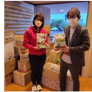
③最寄り施設へお届け