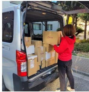
②仕分け・梱包、運搬