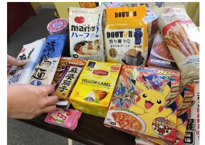
<前回のフードドライブ実施風景>

全国各店で集められた食品は、それぞれの店舗のある地域の福祉施設や団体といった地域の方にとって身近なところに、カーブスのコーチが直接お届けしています。これまで 15 回の実施において、参加人数は累計約 178 万人、累計約 2,478 トンの食品が集まっています。