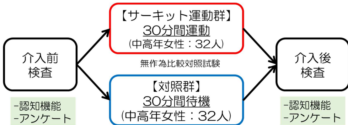
図1 研究の方法の概要