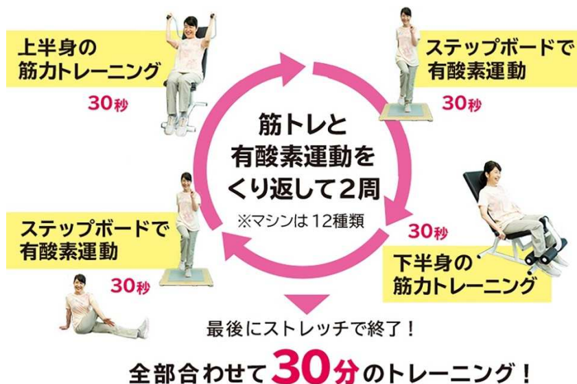
図2 サーキットトレーニングの例