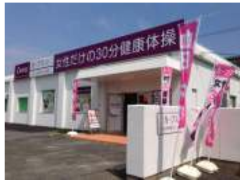
【カーブス大山町健康センター外観】